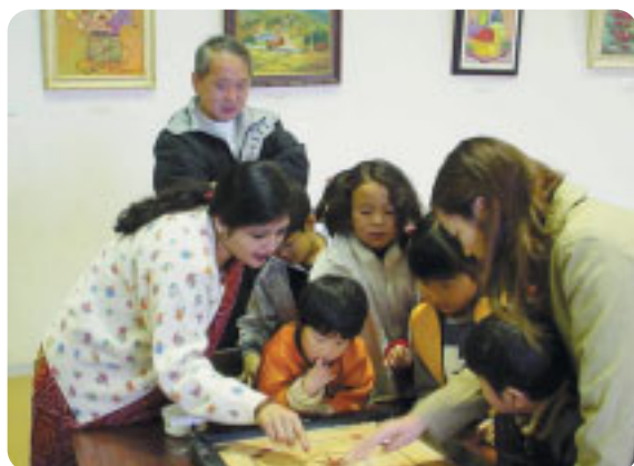
「インドのゲーム」(双葉町)