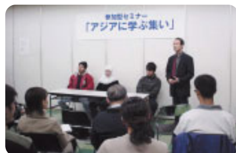
「アジアに学ぶ集い」