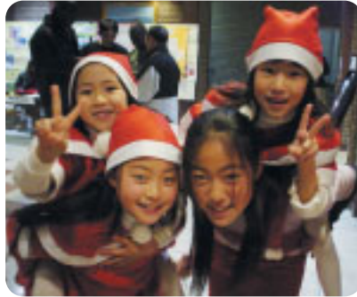
「子どもたちも大はしゃぎ！」