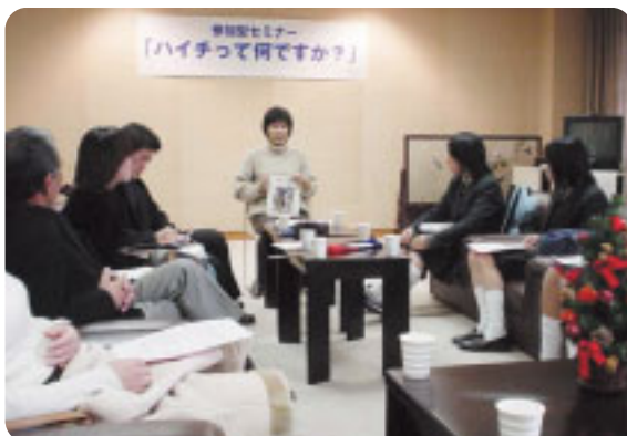
「ハイチって何ですか?」