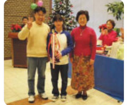
「ソロプチミスト杯卓球大会で優勝したお二人」