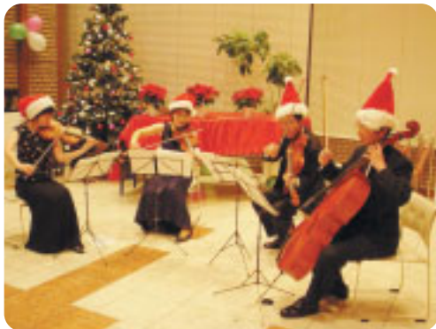
「美しい音色で聴衆を魅了したカルテットのみなさん」