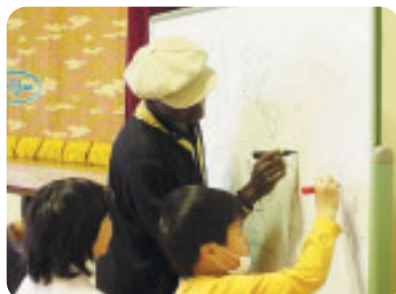
「アフリカの遊び」(双葉町)

今年度は、富士吉田市でドイツ音楽、敷島町でブラジル料理、そして白根町、八代町でタイ文化、双葉町では世界の遊びを紹介しました。