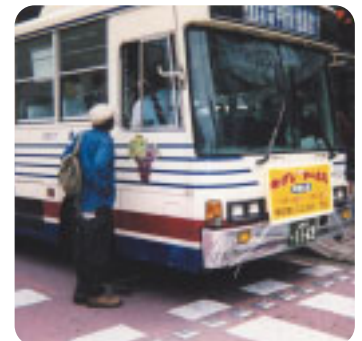
「外国人による山梨路線バス体験」