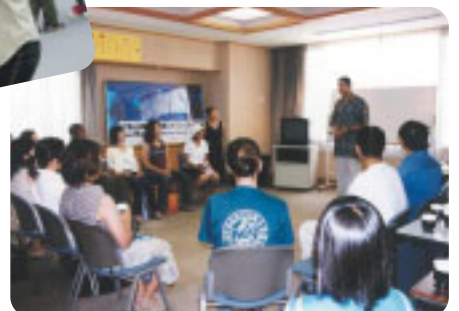
「異文化ワークショップ」