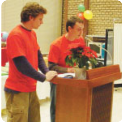
「ワールドキャンプ・フォー・キッズより説明」

さまざまなジャンルの音楽やパフォーマンスほか、国際卓球大会、チャリティ・オークション、世界の屋台など国際色豊かに開催しました。パーティーの収益金 合計129,377円は、「ワールドキャンプ・フォー・キッズ」へ送らせていただきました。