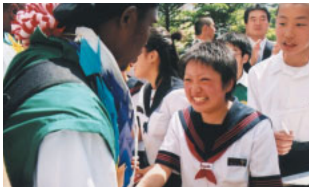
カメルーン・チームに大感激!

W杯カメルーン受け入れ実行委員会は、富士吉田市の富士山アリーナでW杯のカメルーン代表チームの「歓迎の集い」を開き、両国の親善と健闘を誓いました。