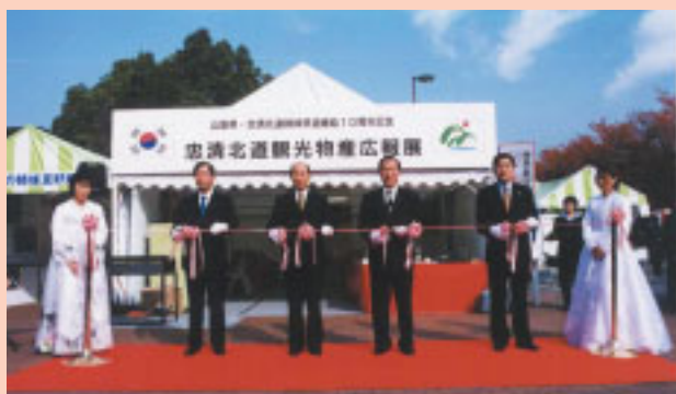
韓国・忠清北道の友好訪問団来県

山梨県は韓国忠清北道との姉妹県道締結10周年記念式典出席のため、天野知事ら山梨県訪問団が訪韓しました。一行は式典を通して親交を温め、一層の交流推進を誓い合いました。