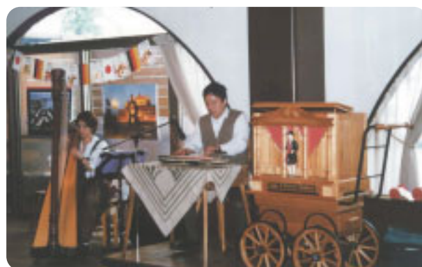
「ドイツ音楽」(富士吉田市)