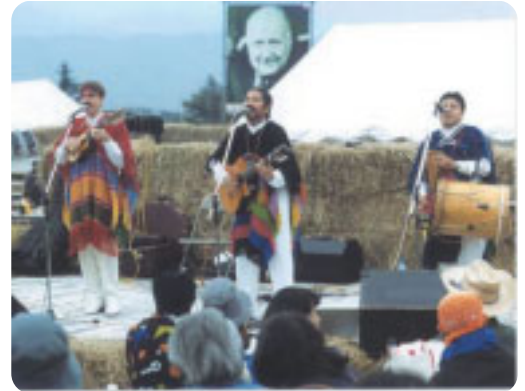
「ポール・ラッシュ祭 / 国際親善コンサート」