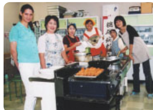
「ブラジル料理」(敷島町)