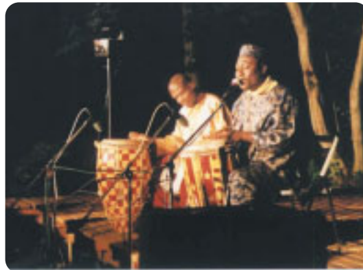
「ハイチ カリブの鼓動」