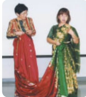
「国際フェスティバル ～世界の文化体感～」