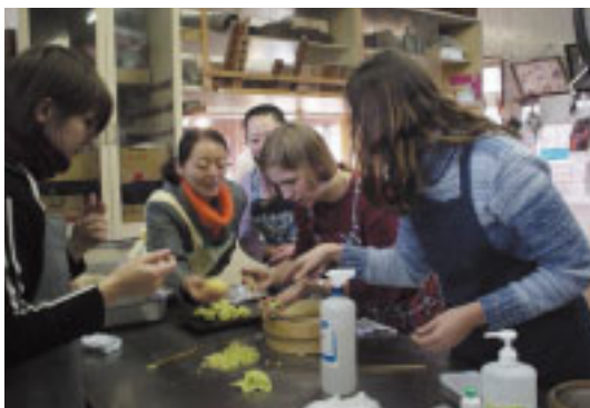
「和菓子作りに挑戦！」