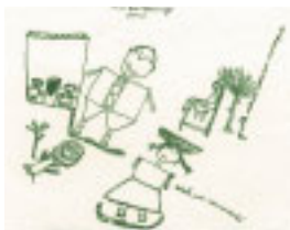
「ハイチの子供たちの作品」

開発・環境・人権・平等の問題をテーマに、参加型学習の手法によるセミナー。「アジアに学ぶ集い」「ハイチって何ですか?～メディア・音楽・コーヒー・アートで知るハイチ～」「国際理解・国際協力の新しい学び方～ワークショップを体験しよう!～」を開催しました。