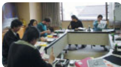
「書道ワークショップ」