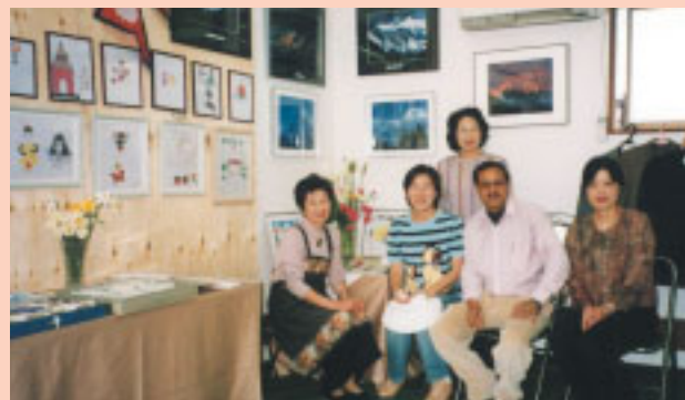
ネパール障害児の絵画展

6 / 1 から運動靴の提供や輸送費の募金協力を呼びかけていました。集められた靴は、マザーランド・アカデミーを通じて、年内中にはマリの小中学校に届けられます。