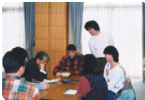
「国際理解・国際協力の新しい学び方 ～ワークショップを体験しよう!～」