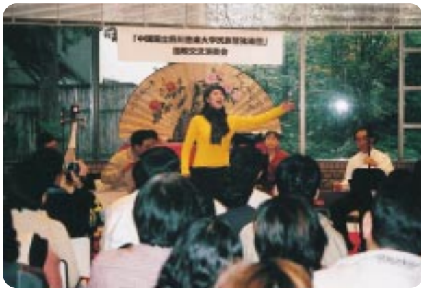
「中国四川省国立四川音楽大学民族管弦楽団のみなさん」

10/26 四川省・国立四川音楽大学民族管弦楽団国際交流招へい委員会は、第1回やまなし県民文化祭の一環として、中国四川省国立四川音楽大学民族管弦楽団による国際交流演奏会を開きました。中国の伝統的な民族音楽を紹介するとともに、伝統音楽を通じて文化交流を図りました。