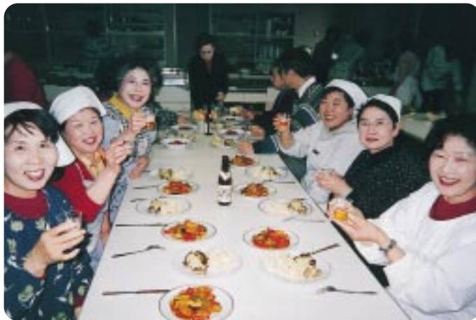
「フランス、ベルギーの食文化にふれて (八代町)」

異文化やその背景にある風俗や生活習慣などに対する理解を深めるため、県内在住外国人やさまざまな分野で活躍している地域在住の人を講師に招き、世界の料理、音楽、舞踏、生活習慣の紹介・体験などさまざまな講座を開催しました。今年度は、白根町でブラジル、下部町ではタイ、そして八代町では、フランス、ベルギー文化を紹介しました。