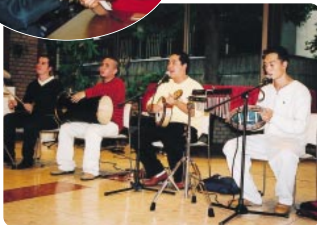
「国際色豊かに盛大に行われた国際フェスティバル」