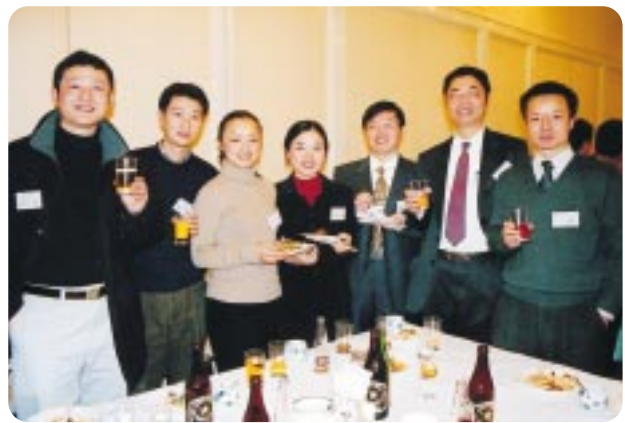
「四川省からの留学生、海外技術研修員たち」

12/21 法務省は、山梨県内への東京入国管理局出張所の設置を認めました。平成14年、春、甲府市内に新設されました。