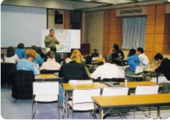
「エイズ・ワークショップ」

国際交流員、留学生、ALT、在住外国人をゲストに迎え、サロンの雰囲気の中で各種プログラムを織り交ぜながら、多くの県民と外国人との異文化交流プログラムを開催しました。