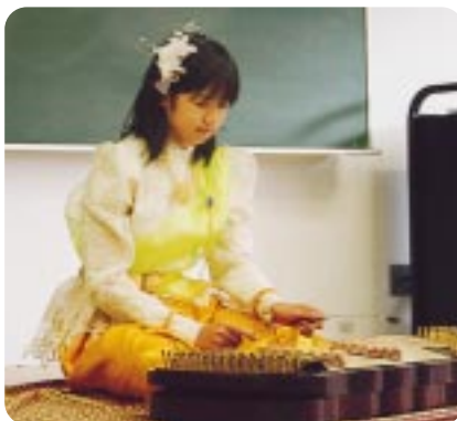
「タイ伝統楽器「キム」演奏 (下部町)」