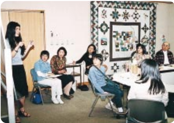
「アメリカのなまり」