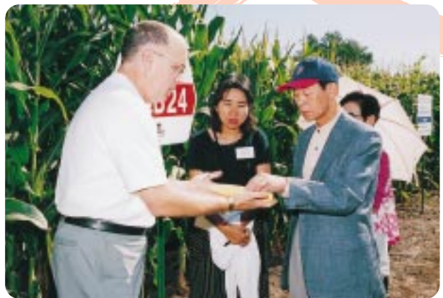
「天野知事、アイオワ コーン・フィールドにて」

8月 8 / 10 アメリカ アイオワ州を訪れた天野知事ら山梨県の訪問団は、姉妹都市締結40周年の記念式典に出席しました。一行は多彩なイベントに参加するなどデモイン市民とのきずなを深めるとともに、交流の一層の推進を誓い合いました。