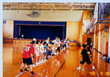
小学生とスポーツ交流する外国青年