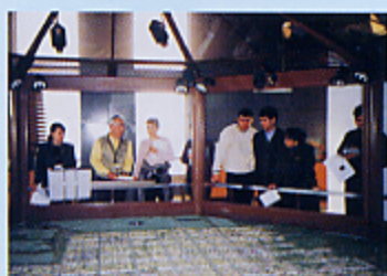
ウズベキスタン観光振興研修生の研修風景