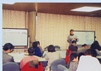
シルク財団のホストファミリー研修風景