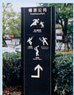
英語と絵文字の入った案内看板