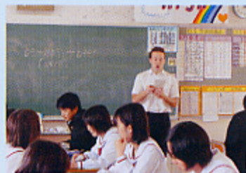
英語授業を行う外国語指導助手